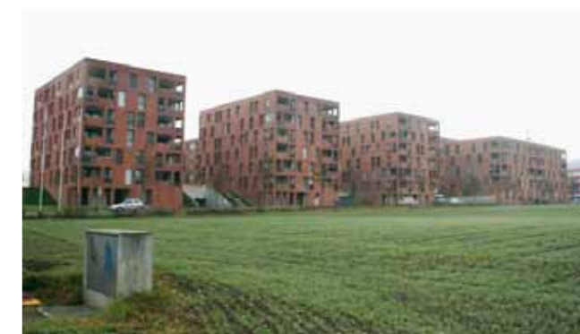
Masseneinwanderung zwingt zur Verbetonierung von Grünflächen.

In rasantem Tempo werden die letzten Grüngelände verbetoniert. Gegen die Wohnungsnot nützt das gar nichts, solange die Masseneinwanderung anhält. So werden nur Übervölkerung und Verkehrschau immer schlimmer. Darum: Einwanderung stoppen – günstige Wohnungen erhalten , sanft renovieren und der Spekulation entziehen .